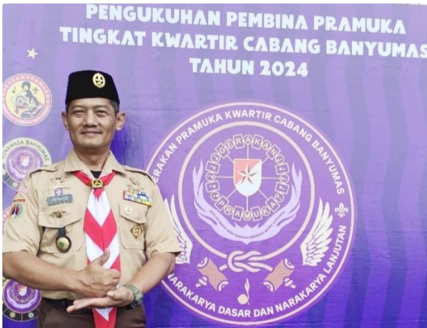
Kapenrem 071/Wijaya Kusuma dikukuhkan sebagai Pembina Pramuka Kwartcab Banyumas